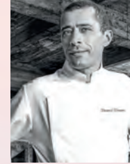
Pascal PICASSE PARK 45 (1 étoile)

Lundi 29 Oct. Show Cooking 11h30 Atelier 12h30