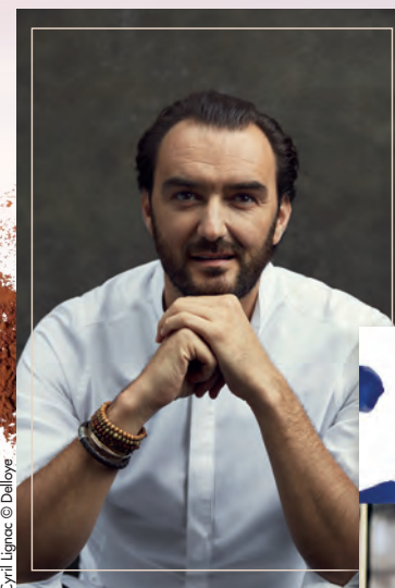
Cyril Lignac © Delloye

en partenariat avec votre magasin Galeries Lafayette