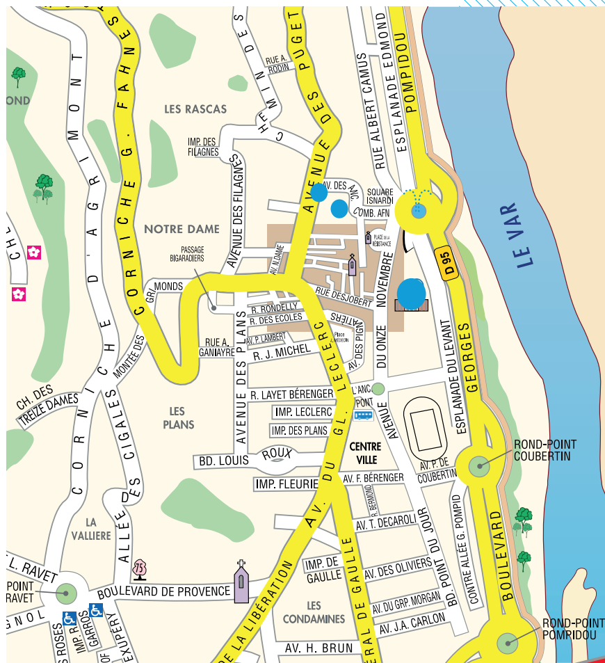
LIEUX DE LA MANIFESTATION

LA VILLE DE SAINT-LAURENT-DU-VAR ET L'ASSOCIATION KROMATIK REMERCIENT LEURS PARTENAIRES